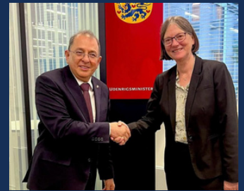
MINISTERIO DE ASUNTOS EXTERIORES DE DINAMARCA