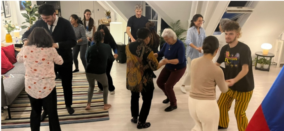
Copenhague, 18 de octubre de 2024

PARA LA CONCIENTIZACIÓN SOBRE EL DÍA MUNDIAL DE LA PROTECCIÓN A LA NATURALEZA, LA EMBAJADA DE COLOMBIA EN DINAMARCA REALIZÓ SU CUARTA SESIÓN DE BIODANZA.